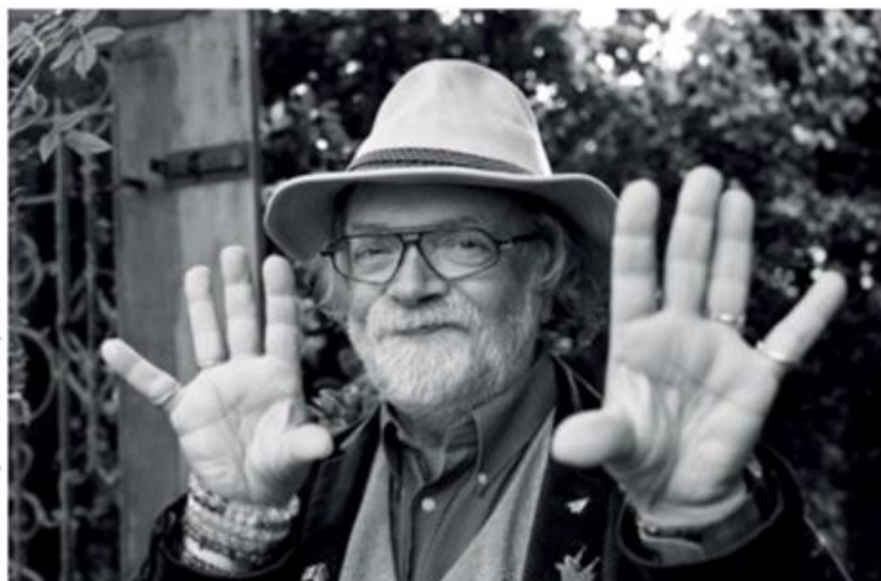
© Sarah Eddy – Au coin des yeux

Ces récits étroitement associés à l'histoire et aux paysages de notre région, sont habités par des êtres inquiétants ou au contraire bienveillants: dragons, dames blanches, fantômes et revenants, fées, diable, sorcières, êtres du monde aquatique... Un monde fabuleux à découvrir.